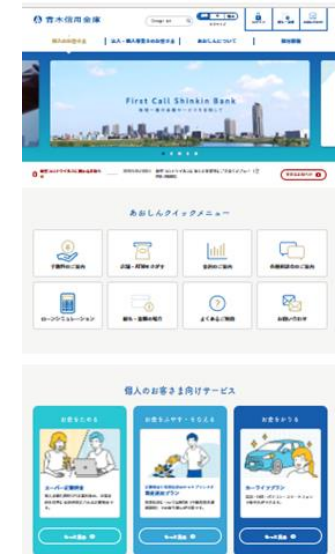
【あおしんホームページ】