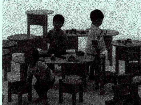
旭川市永山町6丁目6番地の12 ☎47-0100