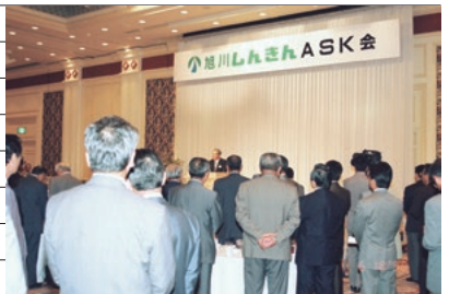
第1回「旭川しんきんASK会」