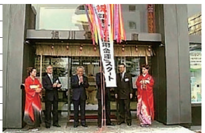
富良野信用金庫との合併