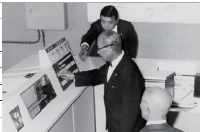
電子計算機稼働開始