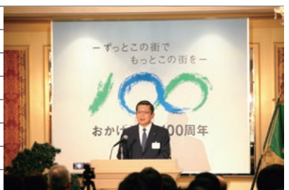
創立100周年記念式典