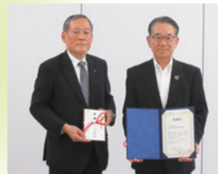
千葉いのちの電話 寄付金贈呈式