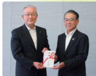
千葉県共同募金会 寄付金贈呈式

長年にわたる地域の皆様からの支援に対する感謝の気持ちを込めて、千葉県共同募金会へ100万円、千葉いのちの電話へ100万円の寄付金を贈呈いたしました。