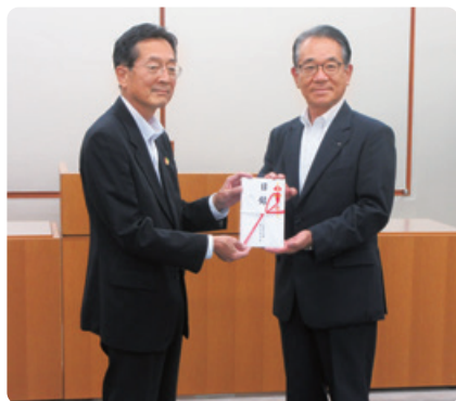
千葉県共同募金会 寄付金贈呈式

創立100周年記念サイト、 当金庫の歴史や 働く職員の様子などを まとめた記念動画は こちらから！