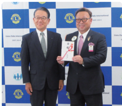
千葉県ライオンズクラブ 寄付金贈呈式