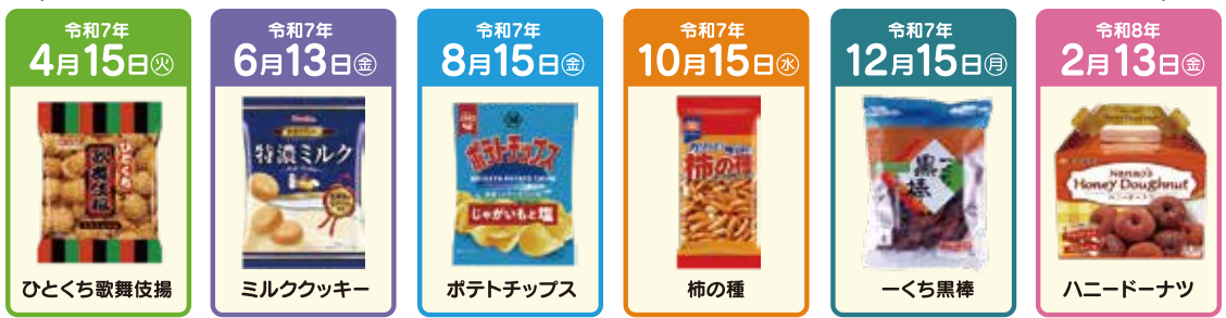
※写真はいずれもイメージです。

●数に限りがございますので、お早めにご来店ください。●ATMでのお取引のお客様は通帳を窓口までお持ちください。