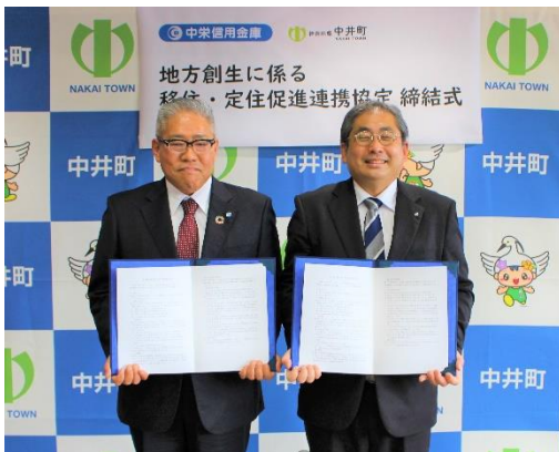
（左から北村理事長、戸村町長）