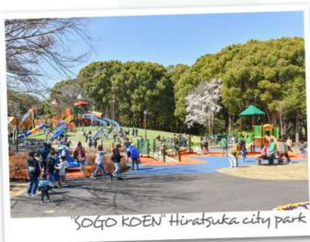
SOGO KOEN Hiratsuka city park

日本人ならみんな大好きな富士山。湘南の街の中でも平塚は富士山が近いので、一段と大きく、雄大な姿を楽しむことができます。季節や時間によって様々な表情を見せる富士の借景を、平塚で暮らせば手に入れることができます。