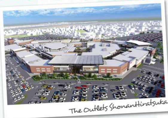
The Outlets Shonan Hiratsuka

利便性の高さが魅力の一つである平塚市は、駅を中心に大型商業施設やスーパー、飲食店など様々な施設が整っていますが、2023年春に湘南最大級のショッピングモール「ジ アウトレット湘南平塚」がツインシティ大神地区にオープン！