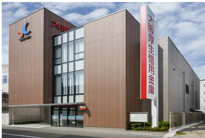
阪急茨木支店 新設オープン（10月）

現在、当金庫は大阪府内に29の店舗がございます。2021年度は阪急茨木支店が新設オープン、本店が新築移転オープンしました。今後も地域から愛される店舗になれるよう日々邁進いたしますので、どうぞよろしくお願いいたします。