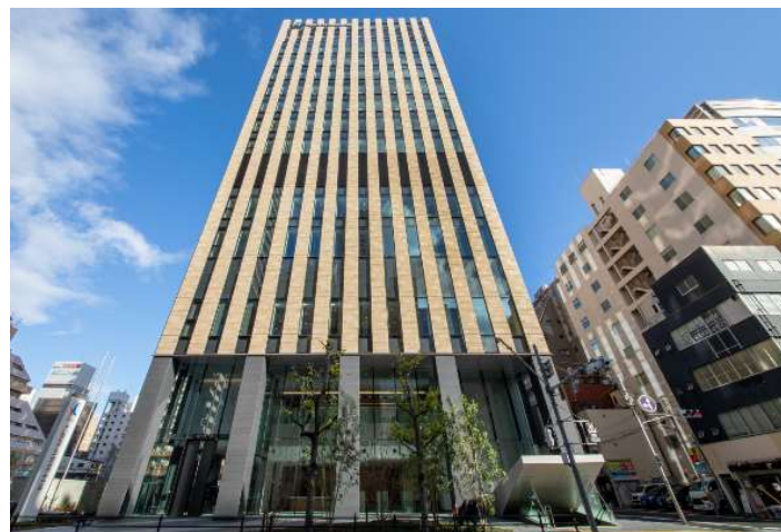
本店 新築移転オープン（3月）