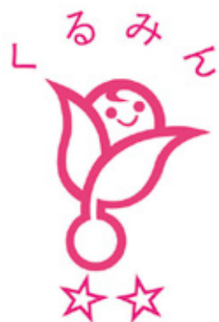
「次世代認定マーク(愛称:くるみん)」

今後も、当金庫で働くすべての職員にとってより良い職場環境を整えていけるよう、検討を重ねていきます。