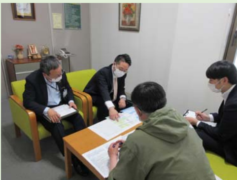
・ 2025年5月20日、西富支店にて開催いたしました。