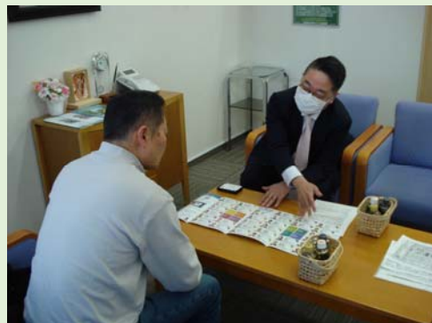
・ 2026年2月16日、中湧別支店にて開催いたしました。