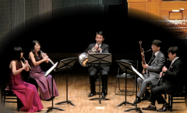
日本フィルハーモニー交響楽団 木管五重奏

日本フィルハーモニー交響楽団 木管五重奏 爽やかな木管五重奏の調べ ライブユニット喜多三 古関メロディーベストセレクション