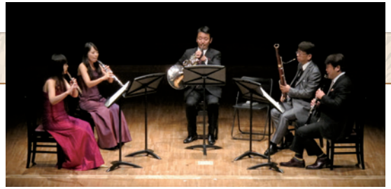
日本フィルハーモニー交響楽団 木管五重奏 (当日のメンバーとは異なります)

●映画「サウンド・オブ・ミュージック」メドレー(リチャード・ロジャース) ●「日本の童謡」メドレー ●アニメ「天空の城ラピュタ」より「君をのせて」(久石譲) ほか