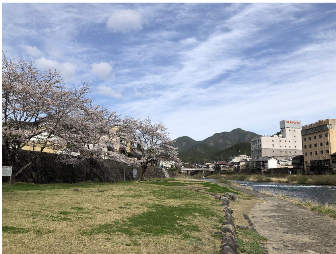
（八幡町：中河原公園）