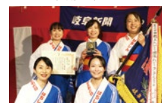
団体おどりコンクール優勝