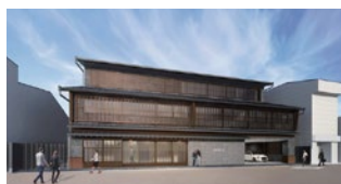
新本部棟完成イメージ

新しい本部棟につきましては、令和8年1月の完成を目指して順調に工事が進められており、建物の外観は昨年5月にオープンした本店営業部と同じく、郡上八幡の街並みにマッチした町屋造りの外観となる予定です。