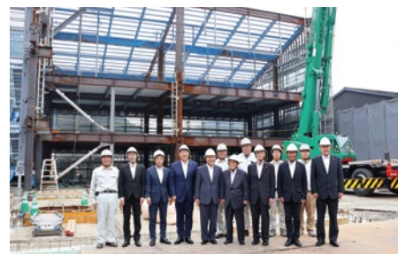
建築が開始された新本部棟