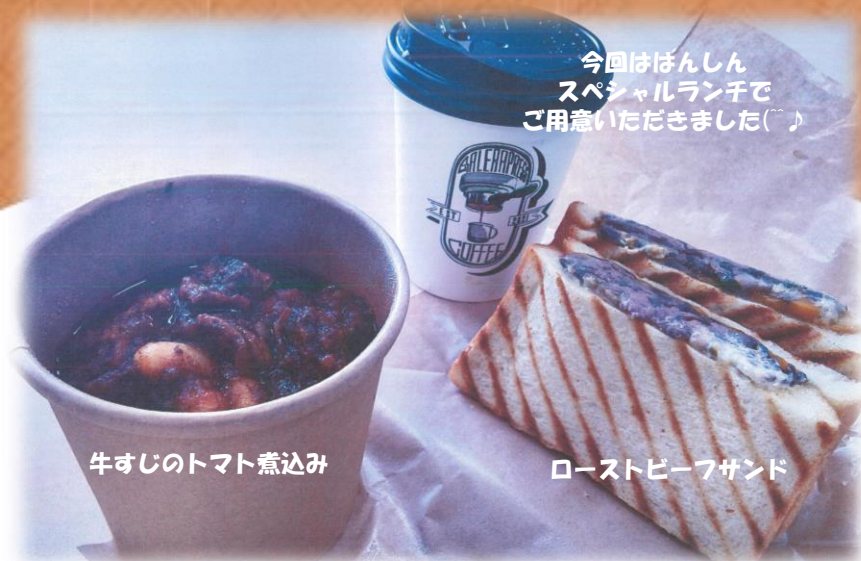
牛すじのトマト煮込み