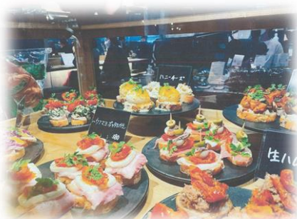
バスクチーズケーキも オススメ☆