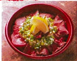
ローストビーフ丼 (温泉たまご・和風わさび・塩だれ) ¥1,000