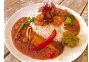
スパイシートマトチキンカレー ¥1,000