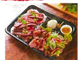
所沢牛ステーキ& ローストビーフ弁当 ¥1,800