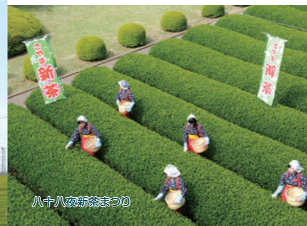
八十八夜新茶まつり