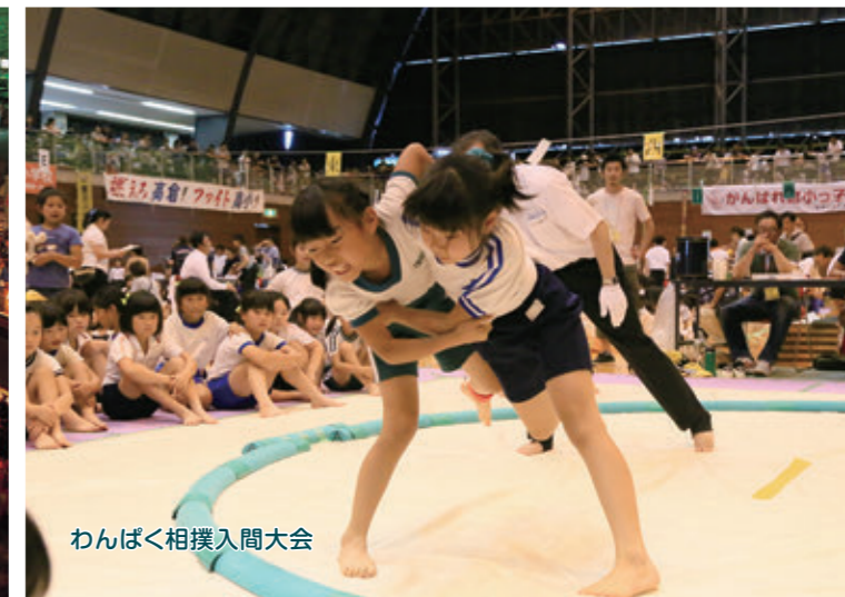
わんぱく相撲入間大会