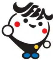
日弁連広報キャラクター ジャフバ