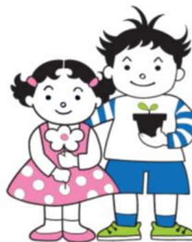
はなちゃん ふたばくん