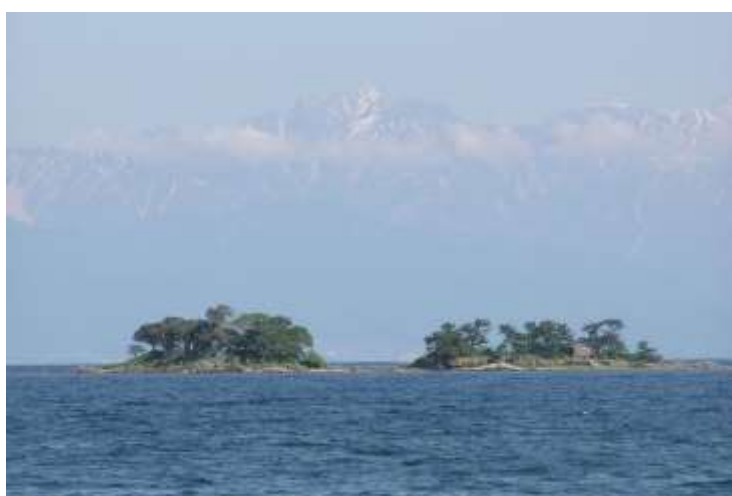
氷見海岸から望む立山連峰と蛇ヶ島