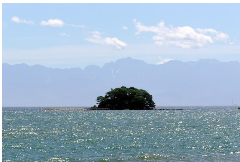
氷見海岸から望む立山連峰と唐島