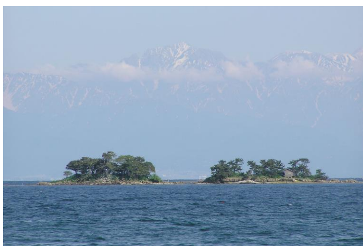
氷見海岸から望む立山連峰と蛇ヶ島