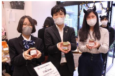
平塚農商高校りんごジャム 能登高校いちじくジャム