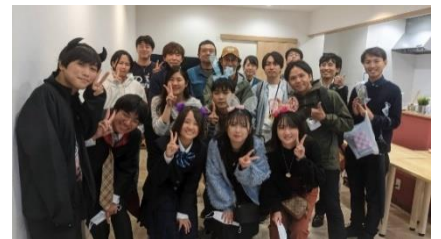
メンバーの集合写真