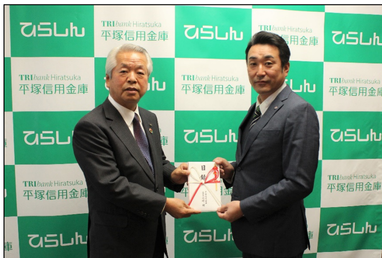
協賛金贈呈の様子

平塚信用金庫は、平成元年（1989年）の平塚 Y E G 設立以来、連携して地域貢献事業に取り組んでおり、本セミナーも第1回から協賛、今回が31回目の開催となります。詳細は、添付チラシのとおりです。皆様のご参加をお待ちしております。