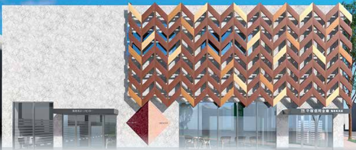
完成予想図 ※画像はイメージです。