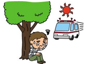
熱中症になった ...等