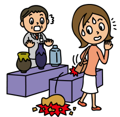
買い物中に誤って 商品を破損