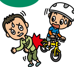
自転車で誤って 他人に衝突