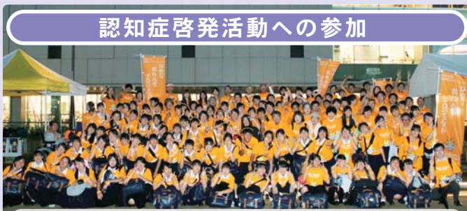
ひめじ認知症啓発協議会が主催する「世界アルツハイマーデー」(9月21日)のボランティア活動に多数の職員が参加しました。