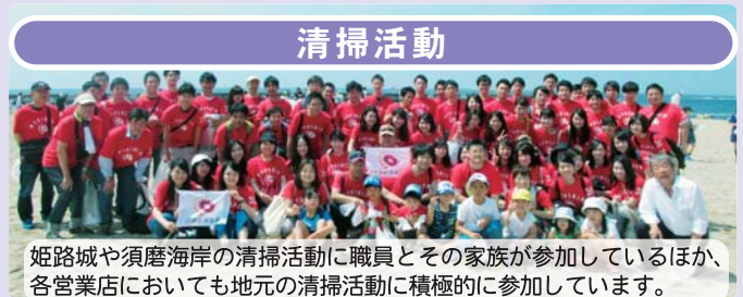
姫路城や須磨海岸の清掃活動に職員とその家族が参加しているほか、各営業店においても地元の清掃活動に積極的に参加しています。