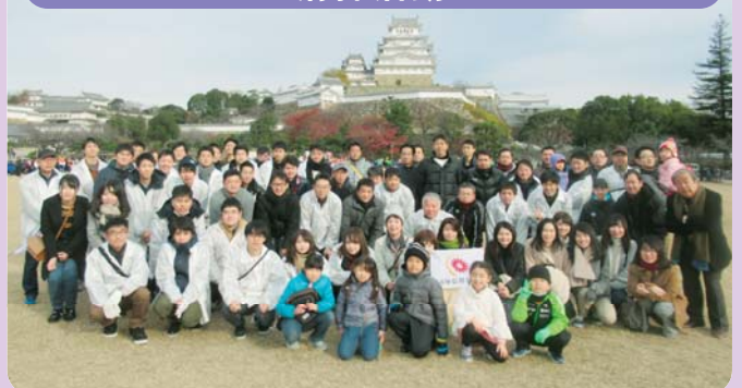
姫路城や須磨海岸の清掃活動に職員とその家族が定期的に参加しています。