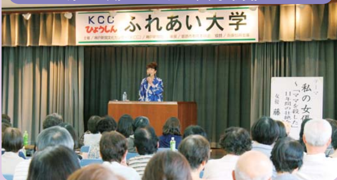
各界でご活躍の方を講師に迎え、幅広いテーマでの講演を開催しています。 (5月開講 年間全9回実施) 第1回(5月) 女優 藤 真利子さん講演