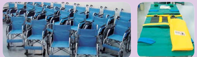
平成21年5月より有志職員から毎月一律100円の募金を募り、地域の社会福祉活動支援に活用しています。第10回目となる今年度は、12地区の社会福祉協議会へ車いす22台を含む介護用品等を寄贈しました。この募金活動による車いすの寄贈台数累計は245台となりました。