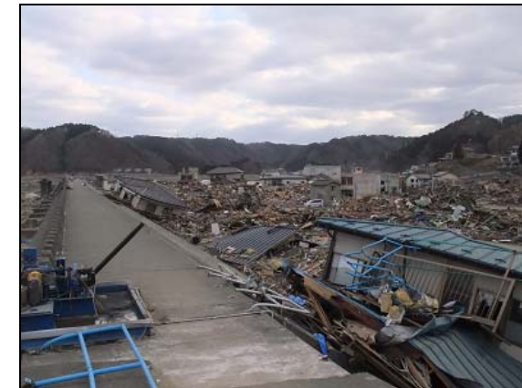
(被災直後の当金庫田老支店周辺)

※ 出所: 総務省統計局(国勢調査速報集計平成22年10月1日現在)および平成21年経済センサス基礎調査にかかる特別集計(平成23年6月15日公表)