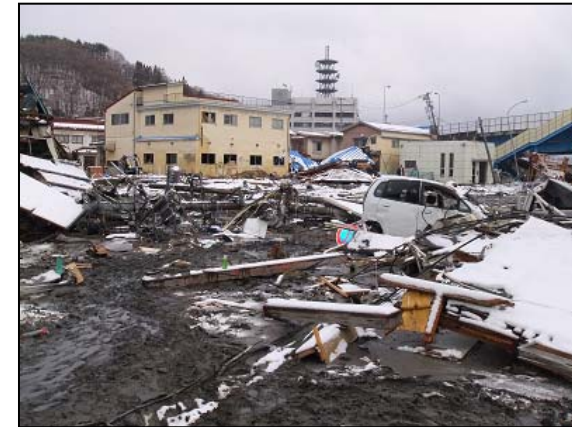
(被災直後の当金庫本店周辺)