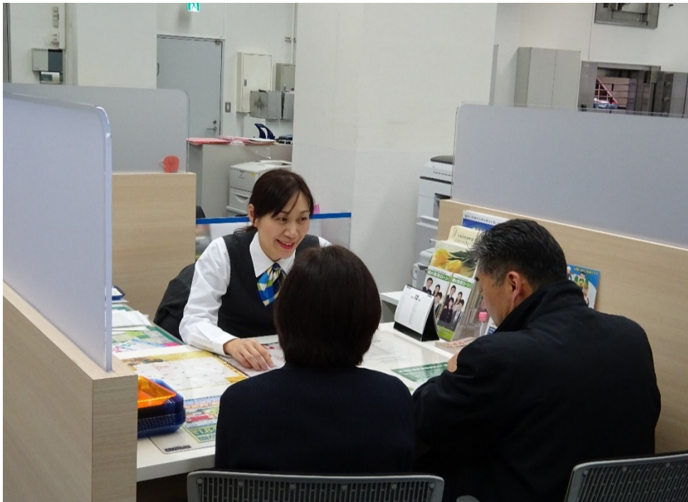
本店「住宅ローン相談会」