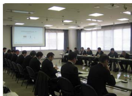
岩手県知財金融推進コンソーシアム