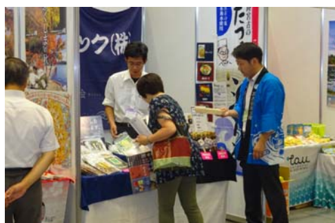
2018 “よい仕事おこし” フェア