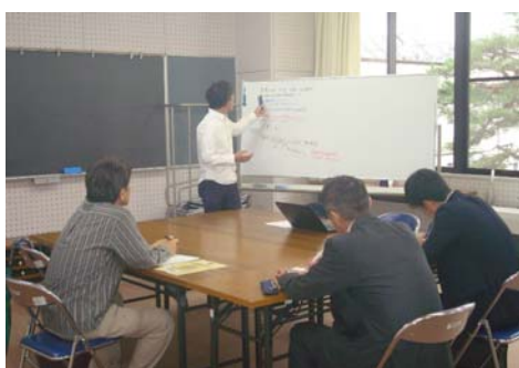
岩手県よろず支援拠点合同相談会

今後とも当金庫は、外部機関等との連携を強化するとともに、当金庫職員の経営改善支援にかかるノウハウ向上を図り、地域のホームドクターとしての地位を確立してまいります。