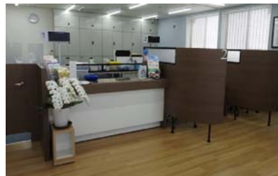
みやしん山田相談プラザ