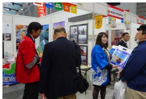
ビジネスマッチ東北 2018