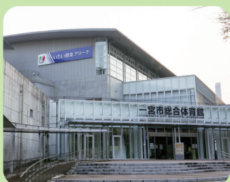
愛称: いちい信金アリーナ いちい信金アリーナA いちい信金アリーナB

2024年4月1日からいちのみや中央プラザ(アリーナ部分)に関し「いちい信金中央アリーナ」としてネーミングライツ・スポンサーとなりました。