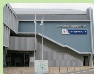
愛称: いちい信金中央アリーナ 名称: いちのみや中央プラザ体育館 (アリーナ部分)

◆ネーミングライツとはスポーツ施設や公共施設などの名称に、企業の社名やブランド名を付けられる権利です。