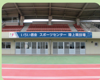
愛称: いちい信金スポーツセンター 名称: 愛知県一宮総合運動場