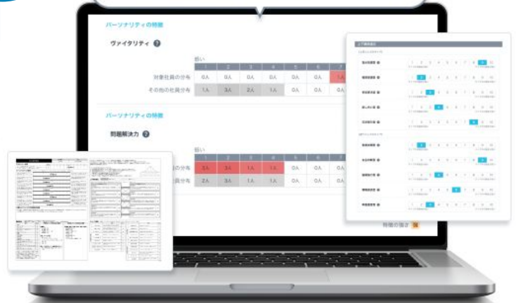
※ご提供データイメージ