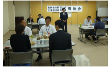
△ 商談会の様子(第1回)

東京地方税理士会と当金庫とで主催する商談会に参加しませんか！？ 受注・発注先と直接面談できる場をご提供いたします。