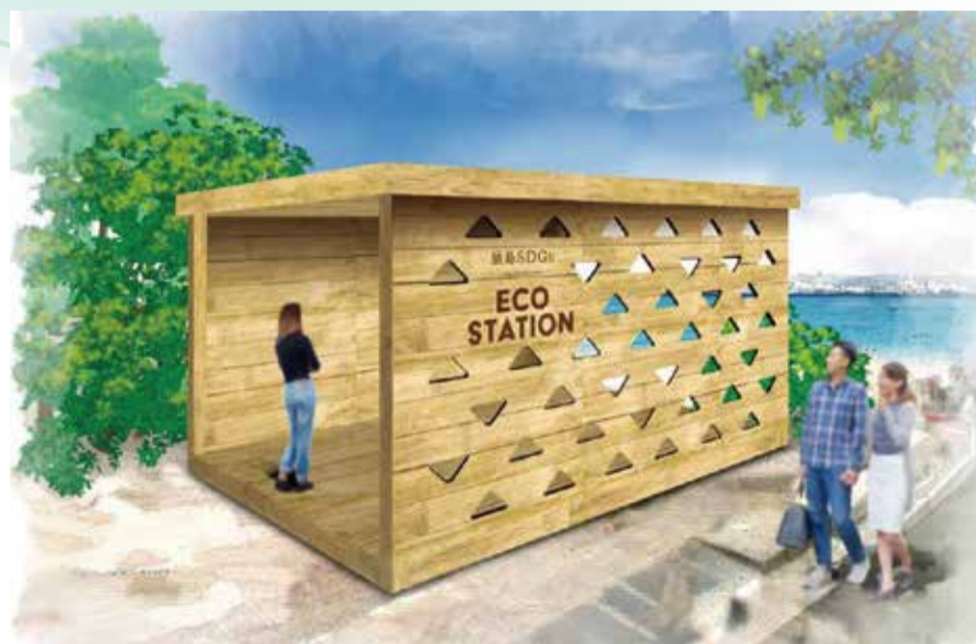
猿島エコステーション（完成イメージ）