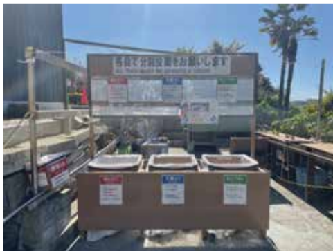
現在のゴミ捨て場

無人島・猿島の豊かな自然や歴史遺産をずっと残したい！—「つづくみんなの猿島プロジェクト」では、いつまでも島の美しさが持続するように、少しずつさまざまな取り組みをしていきます。その最初の一步が【エコステーション】の設置。来島する皆さんが、楽しみながら資源分別ができ、知らず知らずのうちに学べるような「エコのシンボル」にしていきます。この建設費の一部をクラウドファンディングで集めています。皆さまのご支援を、どうぞよろしくお願いいたします。