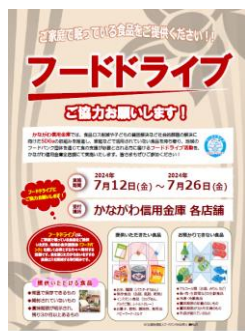
フードドライブチラシ