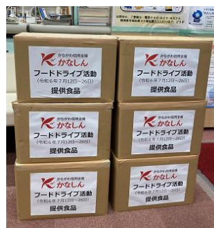
（横須賀・三浦地区・本部）