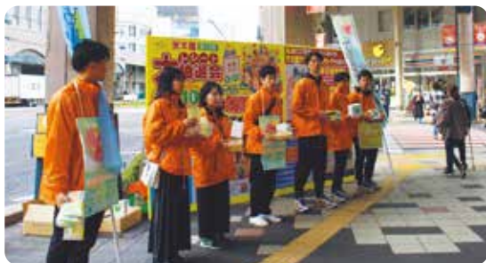
杉の子会『街頭募金活動』