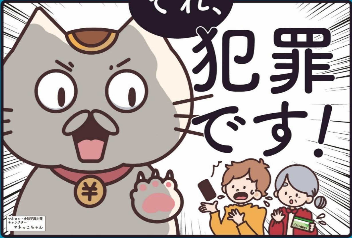
マネロン・金融犯罪対策 キャラクター マネっこちゃん

口座を売ったり貸したりすると 罪になります！ 他の金融機関でも口座の開設や利用が できなくなる場合があります