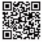
特殊詐欺対策ページ で詳細をチェック！