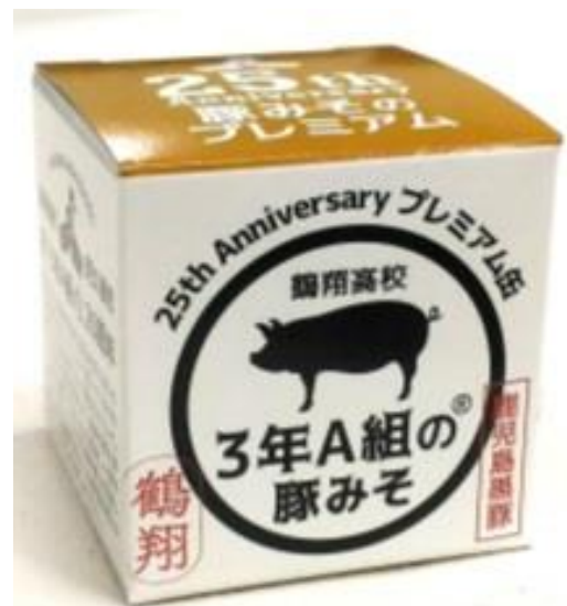
鶴翔高等学校（平成 28 年度） （阿久根市） 3年A組の豚みそ

《本件に関するお問合せ先》 鹿児島相互信用金庫 営業戦略部 地域商社室(担当:肥後) 〒890-0062 鹿児島市与次郎 1-6-30 TEL:099-259-5222 FAX:099-259-5227