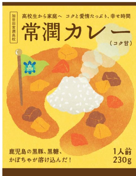
加世田常潤高等学校（平成 29 年度） （南さつま市） 加世田常潤カレー