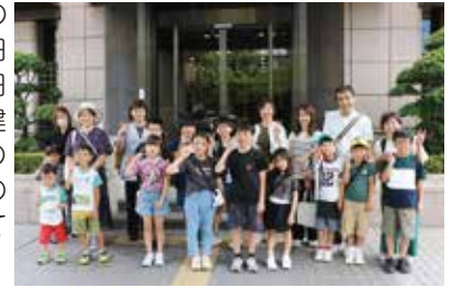
日本銀行岡山支店での集合写真

令和7年8月8日(金)日本銀行岡山支店にて、小学生1年～6年生を対象としたキッズマネー教室を開催しました。総勢20名の親子が参加し、「日本銀行の役割」、「日本銀行の窓口や建物の見学」、「お札の偽造防止」、「お札の重さ体験」について学習しました。」