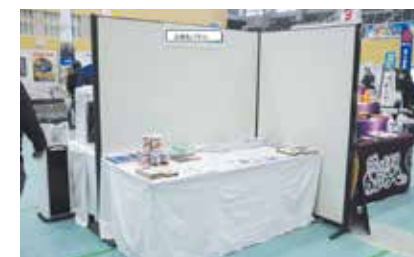
ブース仕様イメージ