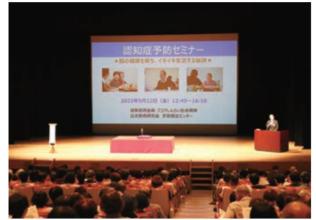
認知症予防セミナー