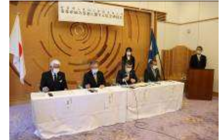
滋賀県と県内3信用金庫との 事業承継の促進に関する協定

産官学金連携の一環として、当金庫とびわこ学院大学・びわこ学院大学短期大学部は相互の連携を強化し、地域の活性化及び人材教育・育成・交流を図る事により、地域社会の持続可能な発展並びに課題解決の実現を目指