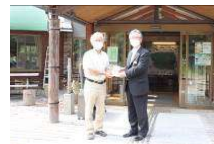
河辺いきものの森への寄付