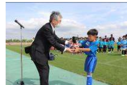
湖東信用金庫理事長杯 少年サッカー大会

また、役職員の有志による東近江市「こども未来夢基金」への継続的な寄付、営業エリア内の小学生を対象とした湖東信用金庫理事長杯少年サッカー大会の開催、金融教育の出前授業を実施いたしました。その他、職場体験学習として地域の中学生の受け入れなどにより、地域との子育て支援を通じた繋がりを図っております。