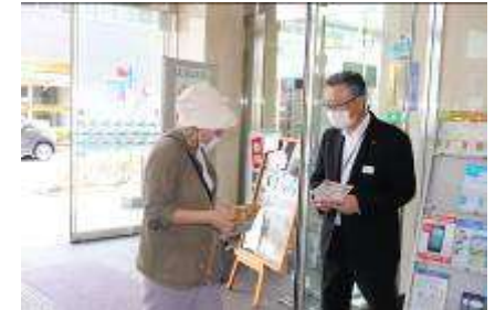
振込め詐欺防止啓発活動 (湖東信用金庫本店)

振込め詐欺等特殊詐欺防止啓発活動として、高額な現金引き出し等を希望されるお客さまへの積極的な声掛けに取り組んでいるほか、ATMコーナーには振込め詐欺等注意喚起の貼紙を設置しております。また、お客さまの年金お受取日に、当金庫の窓口にて振込め詐欺等の注意喚起のチラシを配布しております。2021年度は、本店営業部ATMコーナーにおいて、特殊詐欺防止啓発チラシを配布し、お客さまに注意を呼びかけました。