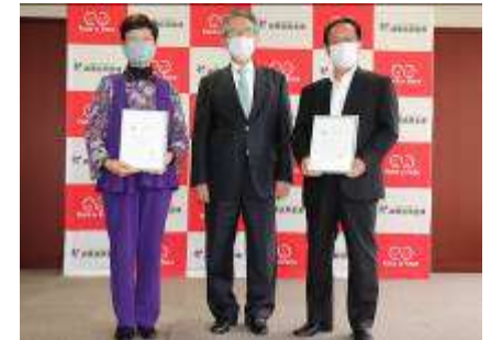
ソーシャル企業認証制度 認証状授与式