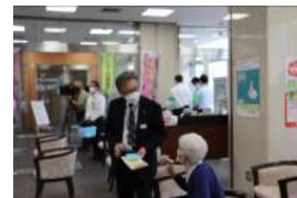
振込め詐欺防止啓発活動 (湖東信用金庫本店)

振込め詐欺等特殊詐欺防止啓発活動として、高額な現金引き出し等を希望されるお客さまへの積極的な声掛けに取り組んでいるほか、ATMコーナーには振込め詐欺等注意喚起の貼紙を設置しております。また、お客さまの年金お受取日に、当金庫の窓口にて振込め詐欺等の注意喚起のチラシを配布しております。2022年度上半期は、本店営業部ATMコーナーにおいて、特殊詐欺防止啓発チラシを配布し、お客さまに注意を呼びかけました。