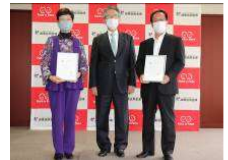
ソーシャル企業認証制度 認証状授与式