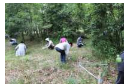
河辺いきものの森 清掃活動