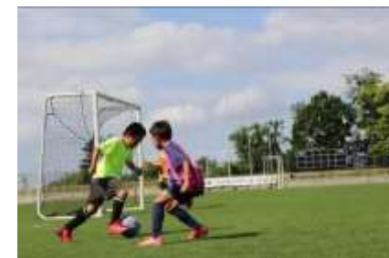
湖東信用金庫理事長杯 少年サッカー大会

また、役職員の有志による東近江市「こども未来夢基金」への継続的な寄付、営業エリア内の小学生を対象とした湖東信用金庫理事長杯少年サッカー大会の開催、金融教育の出前授業を実施いたしました。その他、職場体験学習として地域の中学生の受け入れなどにより、地域との子育て支援を通じた繋がりを図っておりますが、2022年度上半期におきましては新型コロナウイルス感染拡大防止の観点から、職場体験学習の受け入れは中止いたしました。