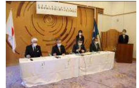
滋賀県と県内 3 信用金庫との 事業承継の促進に関する協定

地場産業や中小零細企業により身近な地域金融機関として深く関わっている当金庫、長浜信用金庫、滋賀中央信用金庫と滋賀県が、それぞれが有する情報、ネットワーク、ノウハウなどの経営資源を有効に活用し相互に連携して取り組みを進めることにより、中小企業の人手不足や経営者の高齢化、後継者難といった構造的な問題の解決に取り組みます。