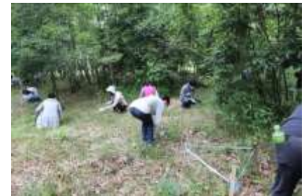
河辺いきものの森 清掃活動