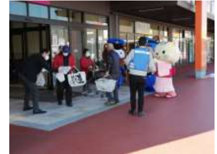
振込め詐欺防止啓発活動 (イオンタウン湖南)

振込め詐欺等特殊詐欺防止啓発活動として、高額な現金引き出し等を希望されるお客さまへの積極的な声掛けに取り組んでいるほか、ATM コーナーには振込め詐欺等注意喚起の貼紙を設置しております。また、お客さまの年金お受取日に、当金庫の窓口にて振込め詐欺等の注意喚起のチラシを配布しております。2022 年度は、本店営業部 ATM コーナー、イオンタウン湖南において、特殊詐欺防止啓発チラシを配布し、お客さまに注意を呼びかけました。