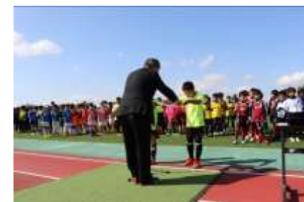
湖東信用金庫理事長杯 少年サッカー大会

また、役職員の有志による東近江市「こども未来夢基金」への継続的な寄付、営業エリア内の小学生を対象とした湖東信用金庫理事長杯少年サッカー大会の開催、金融教育の出前授業を実施いたしました。その他、職