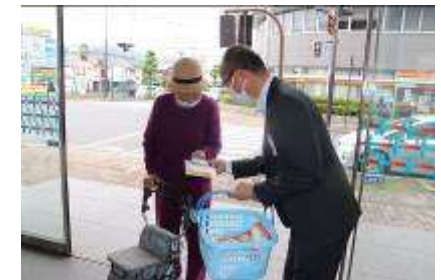
振込め詐欺防止啓発活動

振込め詐欺等特殊詐欺防止啓発活動として、高額な現金引き出し等を希望されるお客さまへの積極的な声掛けに取り組んでいるほか、ATM コーナーには振込め詐欺等注意喚起の貼紙を設置しております。また、お客さまの年金お受取日に、当金庫の窓口にて振込め詐欺等の注意喚起のチラシを配布しております。2023 年度上半期は、信用金庫の日（6 月 15 日）に本店営業部 ATM コーナーや湖南市ショッピングセンター等において、特殊詐欺防