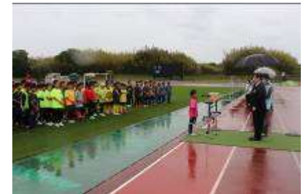
湖東信用金庫理事長杯 少年サッカー大会

また、役職員の有志による東近江市「こども未来夢基金」への継続的な寄付、営業エリア内の小学生を対象とした湖東信用金庫理事長杯少年サッカー大会の開催、子育て世代を対象としたプランニング講座を開催いたしました。