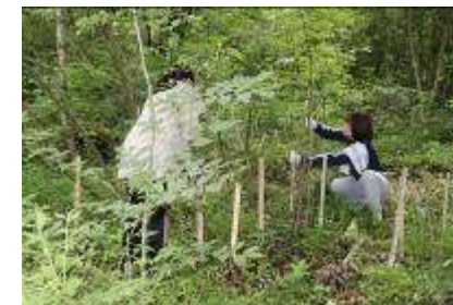
河辺いきものの森 清掃活動