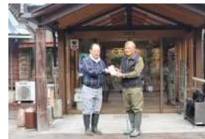
河辺いきものの森 清掃活動