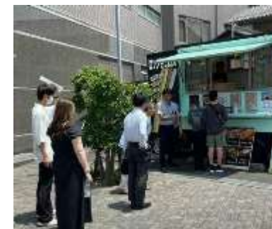
ことしんフードパーク

▶ 当金庫ホームページ https://www.shinkin.co.jp/kotoshin/