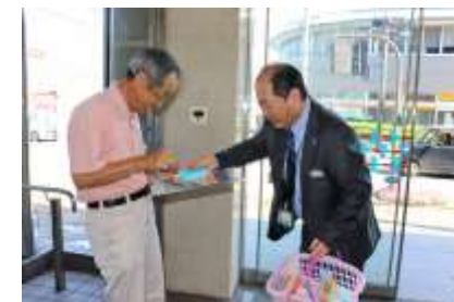
振込め詐欺防止啓発活動

振込め詐欺等特殊詐欺防止啓発活動として、高額な現金引き出し等を希望されるお客さまへの積極的な声掛けに取り組んでいるほか、ATM コーナーには振込め詐欺等注意喚起の貼紙を設置しております。また、お客さまの年金お受取日に、当金庫の窓口にて振込め詐欺等の注意喚起のチラシを配布しております。2024 年度上半期は、信用金庫の日の活動として 6 月 14 日に本店営業部 ATM コーナーや湖南省ショッピングセンター等において、特殊詐欺防止啓発チラシを配布し、お客さまに注意を呼びかけました。