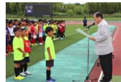
湖東信用金庫理事長杯 少年サッカー大会

また、役職員の有志による東近江市「こども未来夢基金」への継続的な寄付、営業エリア内の小学生を対象とした湖東信用金庫理事長杯少年サッカー大会の開催、子育て世代を対象としたプランニング講座を開催いたしました。