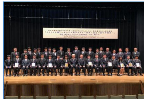
日本工業大学「学生起業家支援プログラム」第14回ビジネスプランコンテストに共催しました。