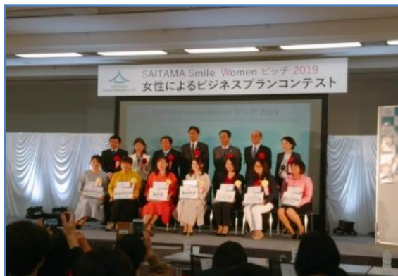
女性起業家ビジネスプランコンテスト「SAITAMA Women Pitch 最終選考会」に当金庫も後援しました。