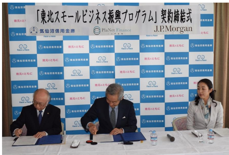
【契約締結式の様子】