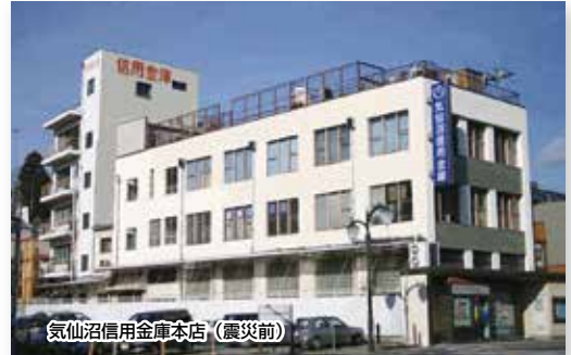
気仙沼信用金庫本店 (震災前)