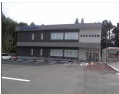
松岩支店 (平成27年3月 店舗新築落成)